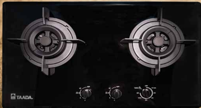
GA751 多田牌 - 本系 - 定時熄火功能 嵌入式煮食爐